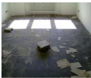
plošče vinaz, linoleji z azbestnimi vlakni