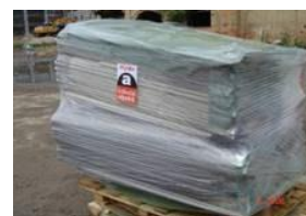
Azbestni odpadki, pridobljeno s spletne strani 30.09.2018