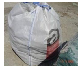
Azbestni odpadki, pridobljeno s spletne strani 30.09.2018