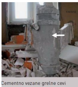
Cementno vezane grelne cevi