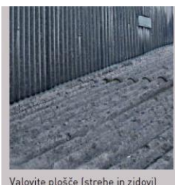
Valovite plošče (strehe in zidovi)