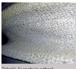
Tekstil, ki vsebuje azbest