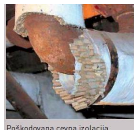
Poškodovana cevna izolacija