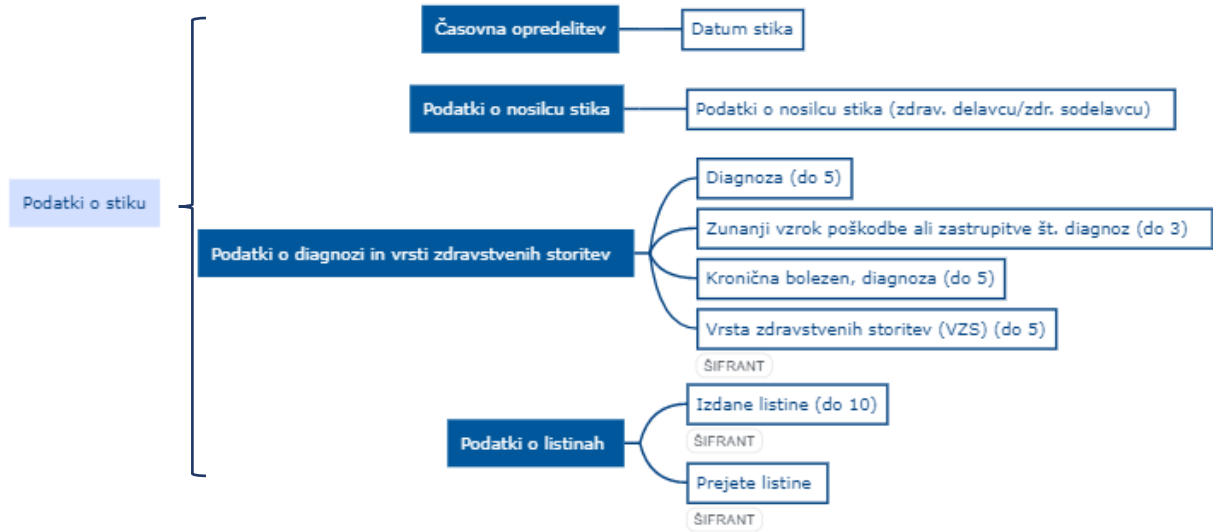
Slika 3: Podatki o stiku