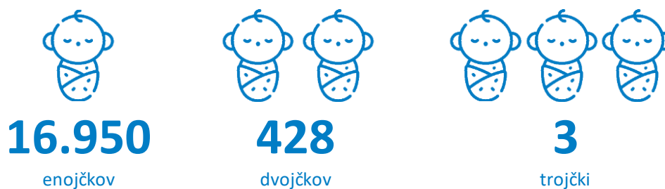
Slika 2: Živorojeni novorojenčki, Slovenija, 2022