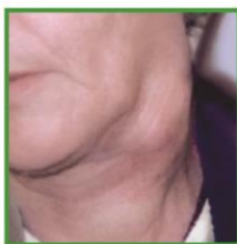
Povečane vratne bezgavke