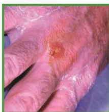
Razjeda na roki