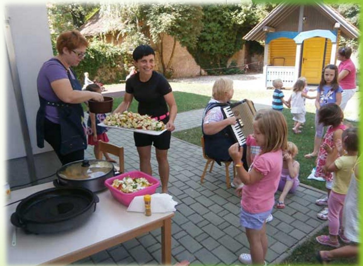
Prepevanje kekčevih pesmi