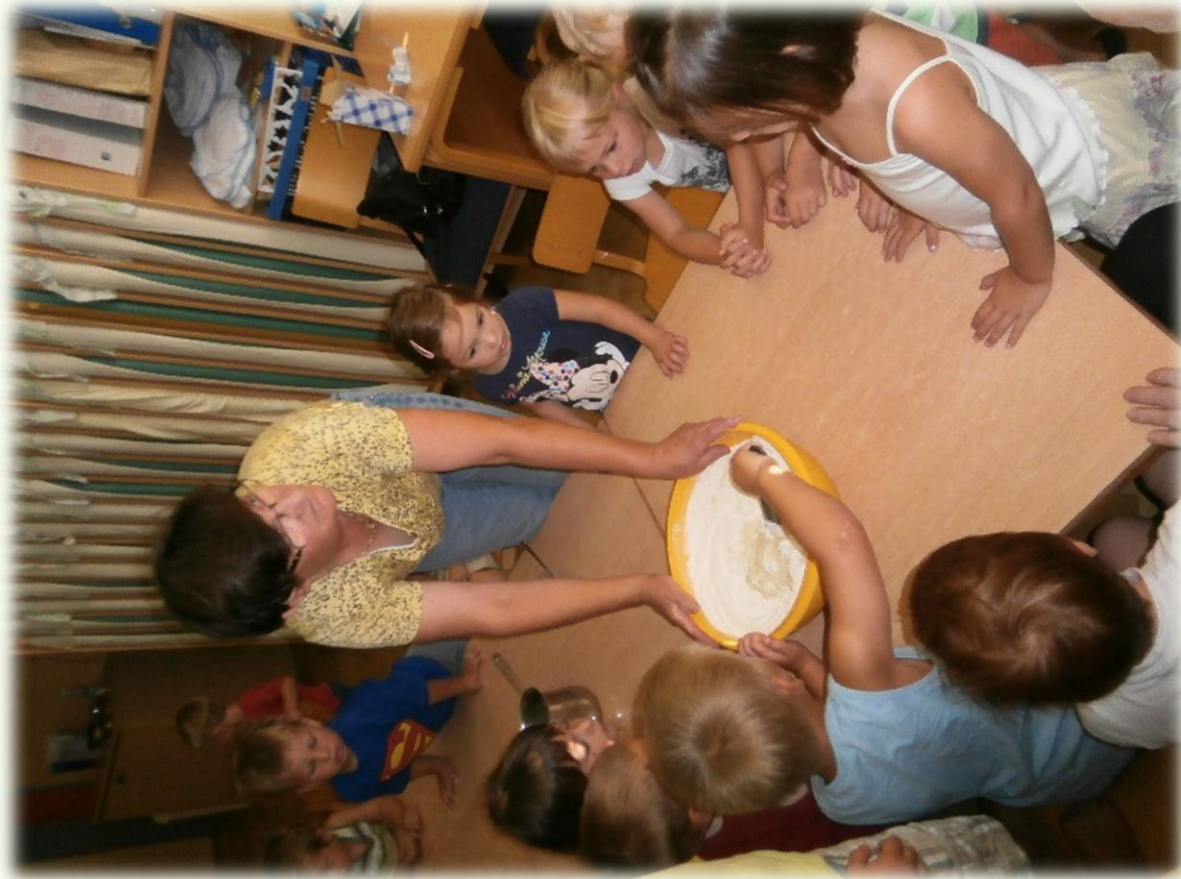
Mesenje testa za kruh