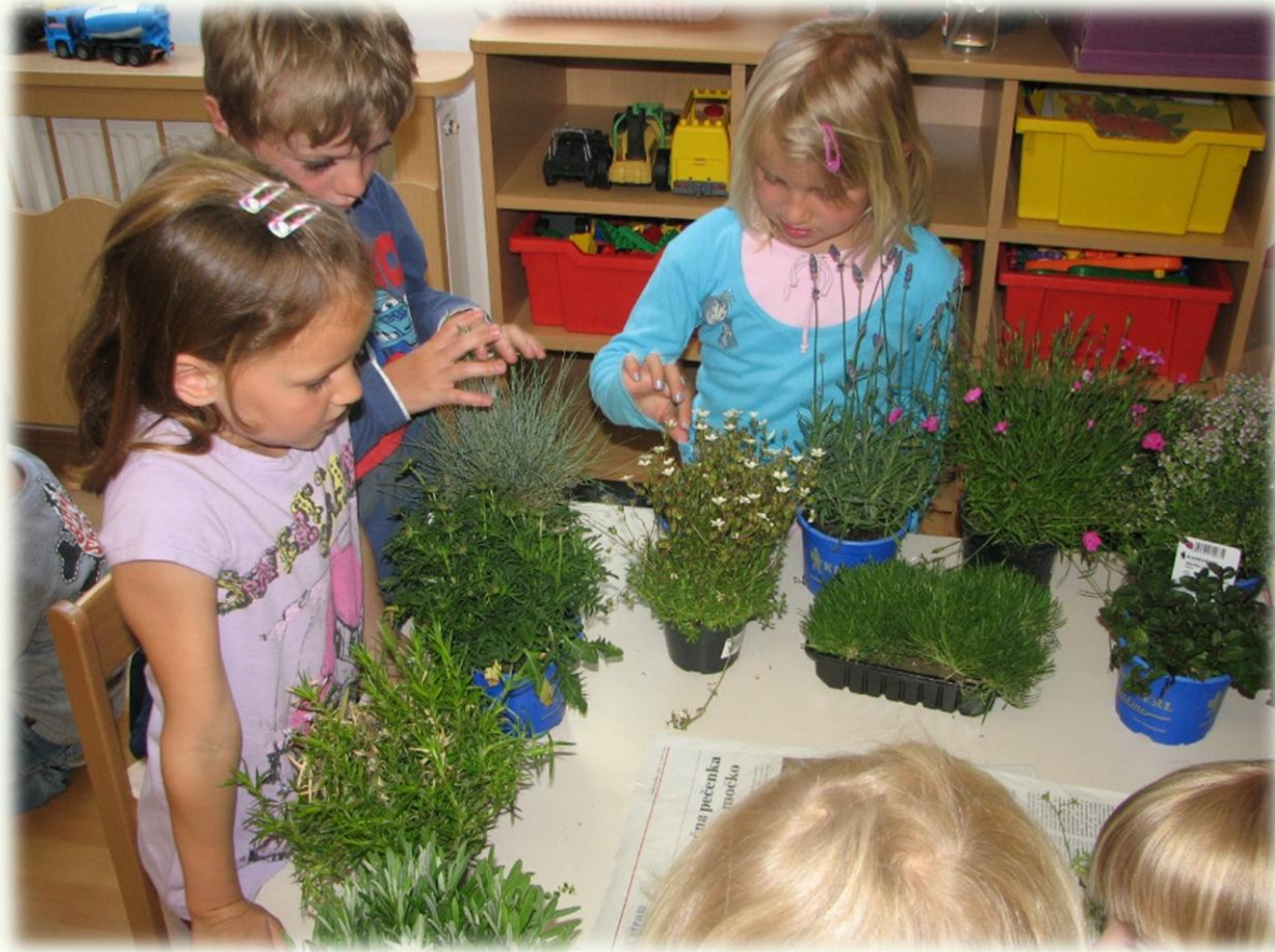
Spoznavanje saditvenih rastlin