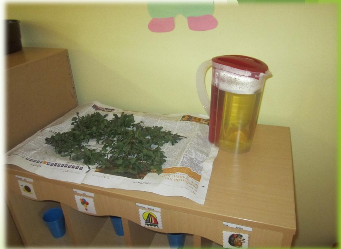
Priprava Pehtinega (zeliščnega) čaja