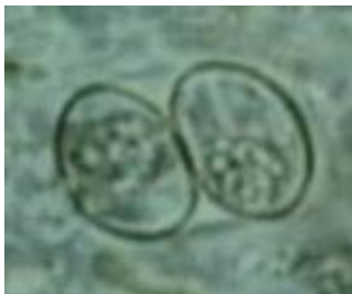
Slika 2: Oocista