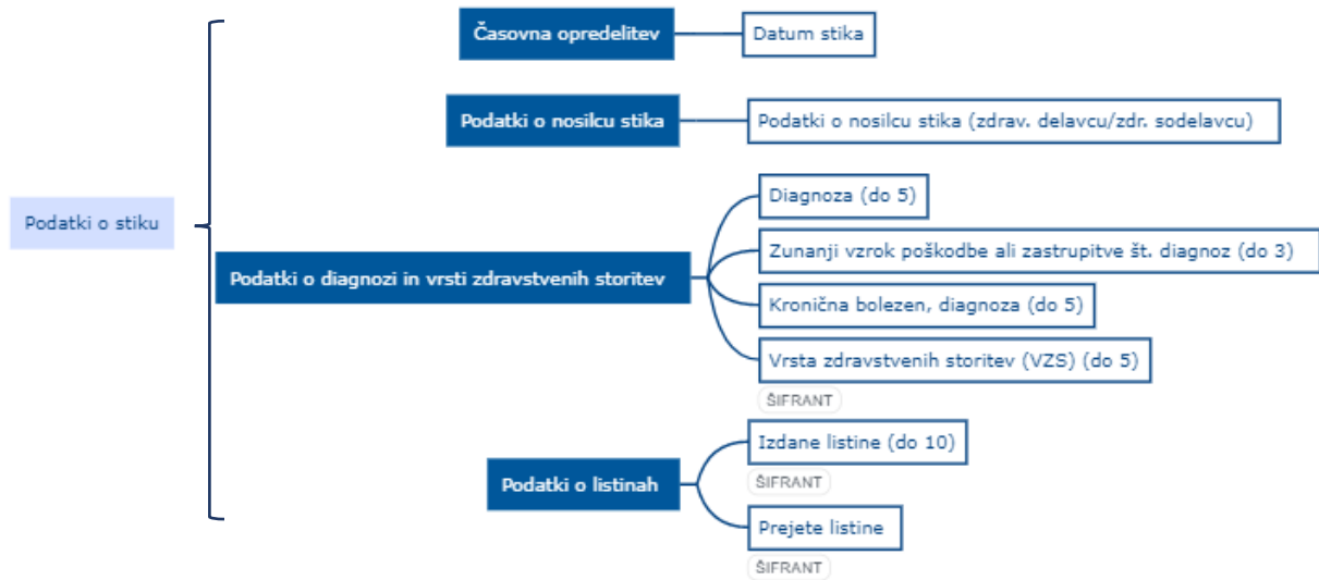
Slika 3: Podatki o stiku