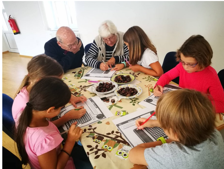
Mednarodni dan starejših, 2018