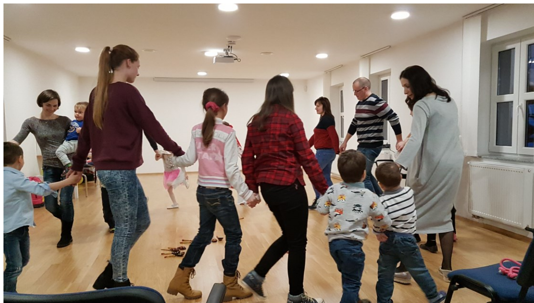
Delavnica ob dnevu žena – ruski šopek, 2018