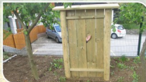
SKRIVALNICA: PREPOZNAJ KDO SE SKRIVA! STIMULIRANJE ČUTILA: VID