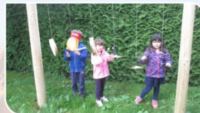
UŽIVANJE NARAVNIH, SEZONSKIH DOBRIN STIMULIRANJE ČUTILA: OKUS