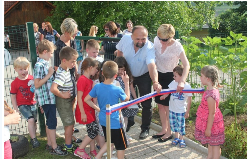
OTVORITEV ČUTNE POTI JUNIJ 2016