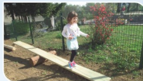
PREVESNA TEHTNICA STIMULIRANJE ČUTILA: RAVNOTEŽJE