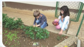
UŽIVANJE NARAVNIH, SEZONSKIH DOBRIN STIMULIRANJE ČUTILA: OKUS