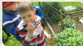
ZELIŠČNI OTOKI STIMULIRANJE ČUTILA: VOH