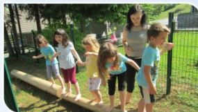
VIŠJA IN NIŽJA RAVNOTEŽNA GRED STIMULIRANJE ČUTILA: RAVNOTEŽJE

Juhej! Naša Čutna pot živi. Ponuja aktivnosti in naloge za spodbujanje vseh čutil. Takole uživajo otroci v rabi čutne poti po posameznih elementih.