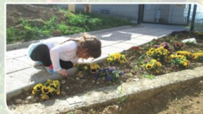
ZELIŠČNI OTOKI STIMULIRANJE ČUTILA: VOH