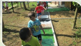
TIPNE PODLAGE ZA HOJO STIMULIRANJE ČUTILA: TIP