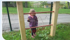
MANJŠE GLASBENO STOJALO STIMULIRANJE ČUTILA: SLUH