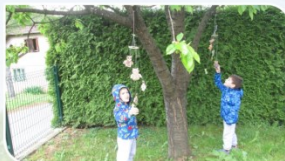
ZVOČNI MOBILI NA DREVESIH STIMULIRANJE ČUTILA: SLUH