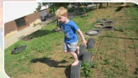
TIPNE PODLAGE V GUMAH STIMULIRANJE ČUTILA: TIP