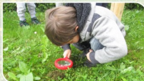
POSTAJA Z LUPO IN DALJNOGLEDOM STIMULIRANJE ČUTILA: VID