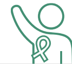
4.3 Tabela 4: Dejavnosti vzgoje za ustno zdravje otrok in mladostnikov po vsebinah, starostnih obdobjih in statističnih regijah, Slovenija, 2021