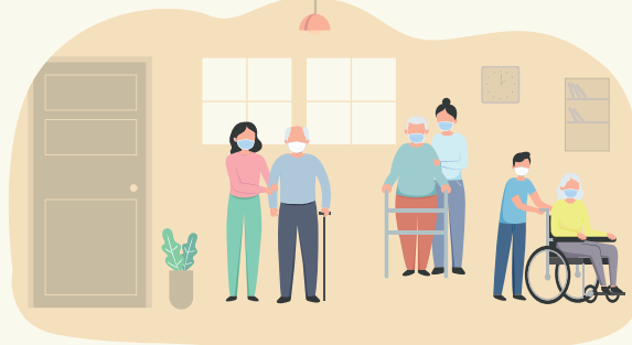
Socialno varstveni zavodi, domovi za starejše občane