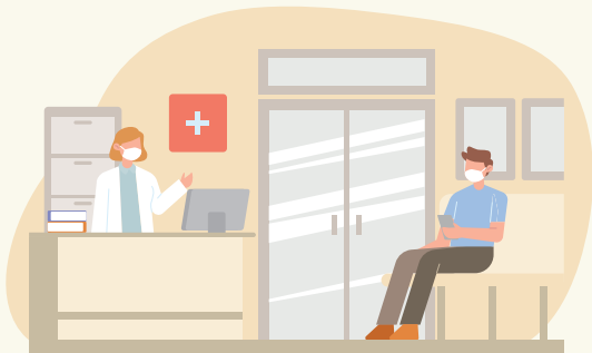
Skupni zaprti prostori zdravstvenih ustanov

Uporaba maske je znak skrbi zase in za skupnost.