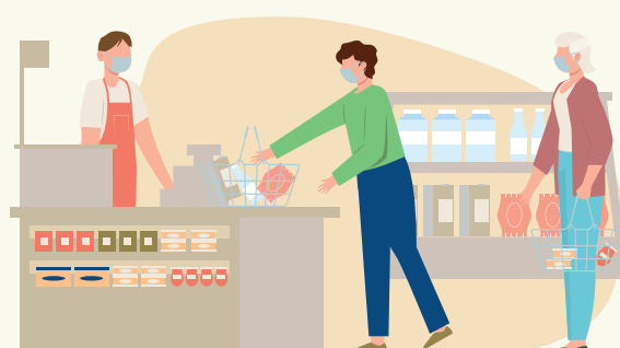
Trgovine, trgovski centri