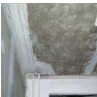
Polnilo za kote v prostoru med steno in stropom