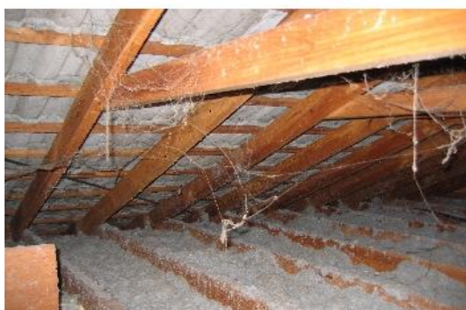
Toplotna azbestna izolacija na podstrešju