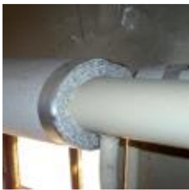
Azbestno platno za izolacijo cevovoda