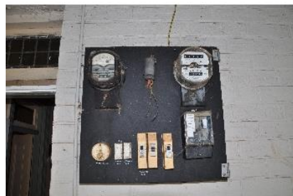
Električna omarica - izolacija