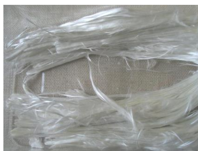
Snopi azbestnih vlaken