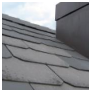
Skodle iz strešne lepenke