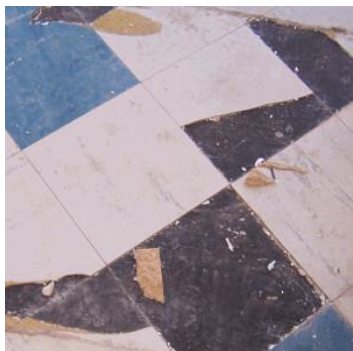
Vinilne talne obloge