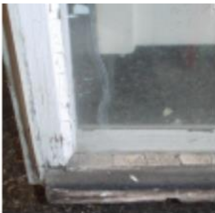
Leseno okno s preperelim okenskim kitom