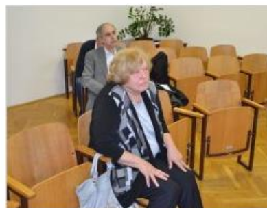
Ginekologinja je bila za zaprtimi vrati krškega sodišča oproščena.

O sodbi smo podrobneje poročali v tiskani izdaji Dolenjskega lista, in sicer v 27. številki 4. julija letos.