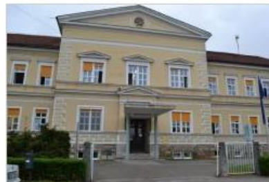
Brežiška bolnišnica.