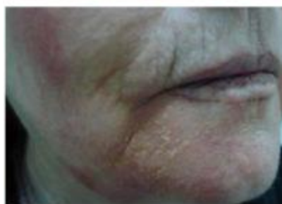
Kontaktni dermatitis na obrazu (4-toluensulfonamide)