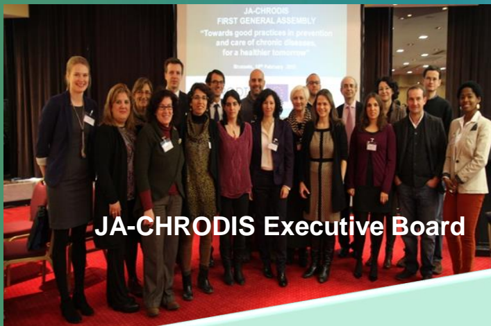
JA-CHRODIS Executive Board