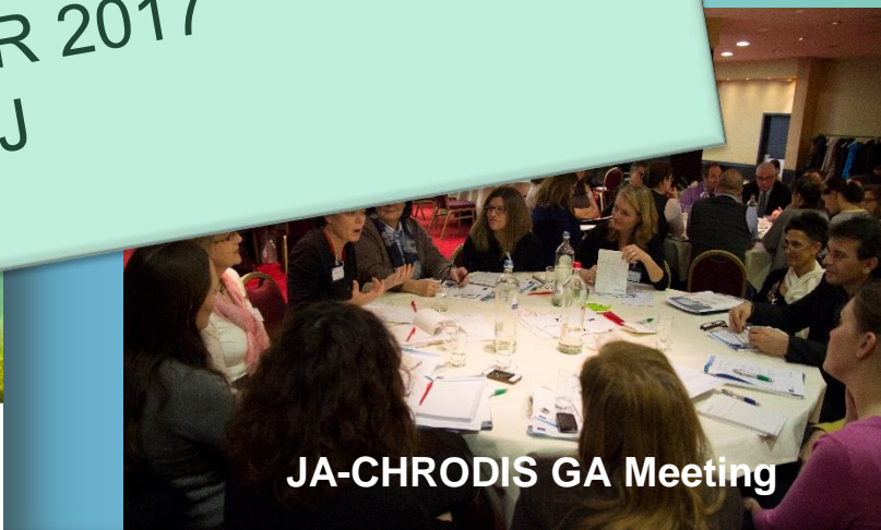
JA-CHRODIS GA Meeting

Zaključna konferenca 27-28 FEBRUAR 2017 BRUSELJ