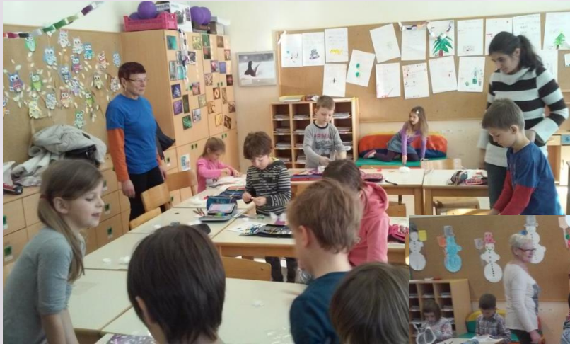
Foto utrinki iz delavnic